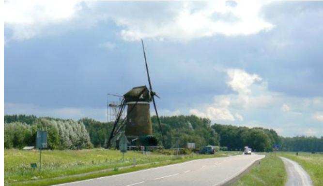
Noord-Zuid wegen met open berm