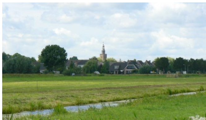
rand van een kern