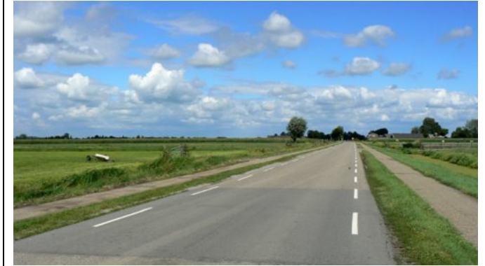
Oost-West wegen pluksgewijs steekeigen beplant.