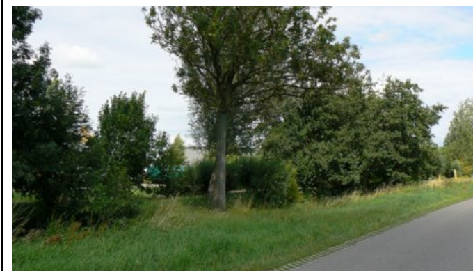
rand van een industrieterrein

Bewoners en recreanten zien liever streekeigen groen in plaats van rood. Weidevogels hebben veel last van kraaiachtigen, die in bomen broeden en hun nesten prederen.